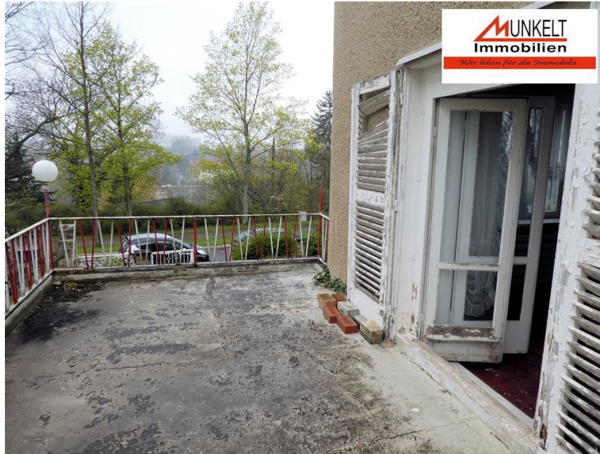
Balkon/Terrasse über Garage