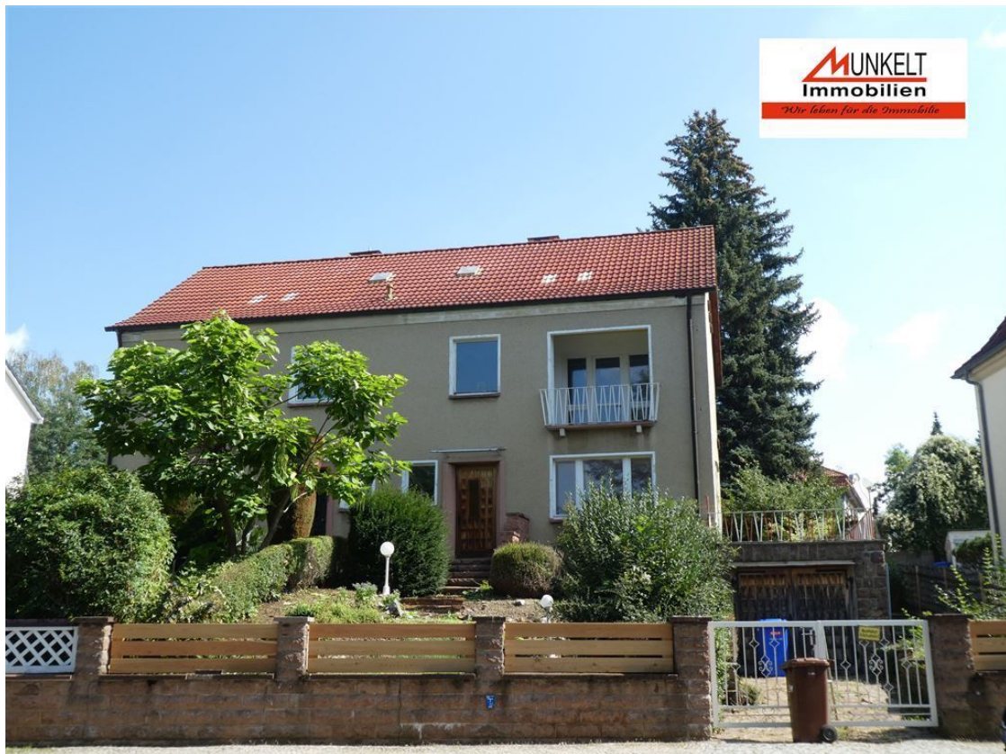
Bornpromenade 16, 06712 Zeitz , Elster